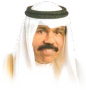
حضرة سمو الشيخ نواف الأحمد الجابر الصباح ولي العهد الأمين