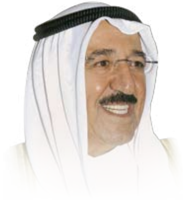
حضرة صاحب السمو الشيخ صباح الأحمد الجابر الصباح أمير الكويت المفدى