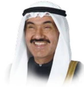
حضرة سمو الشيخ ناصر المحمد الأحمد الصباح رئيس مجلس الوزراء